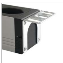
Montagewinkel 19"-Anwendung Cornière de montage application 19"