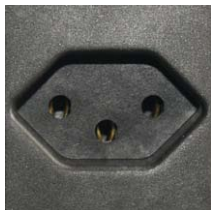
Steckdose Typ 13 Prise type13