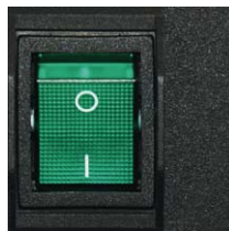
Wippschalter 2-polig beleuchtet Interrupteur à bascule éclairé 2 pôles