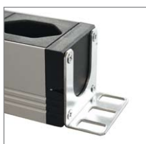
Montagewinkel Aufbauanwendung Cornière de montage pour installation en applique