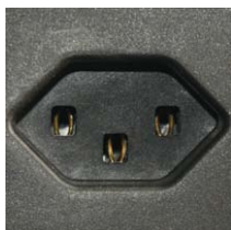
Steckdose Typ 23 Prise type23