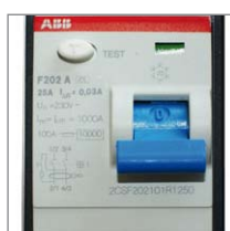
Fehlerstromschutzschalter 30mA Protection à courant de défaut 30mA