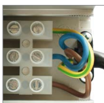
Wiederanschliessbar Peut être re-câblé