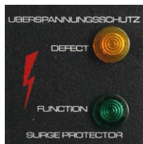
Überspannungsschutz Protection contre les surtensions