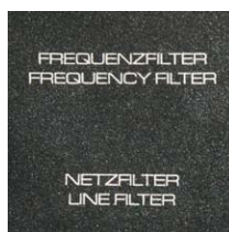
Netzfrequenzfilter Filtre antiparasite