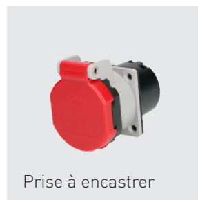
Prise à encastrer