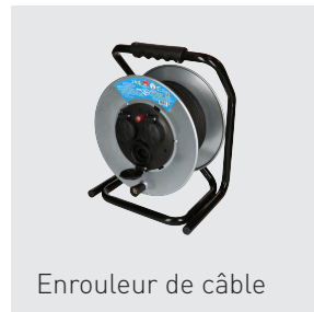
Enrouleur de câble