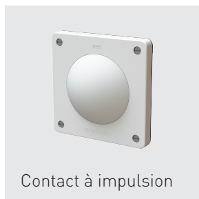
Contact à impulsion